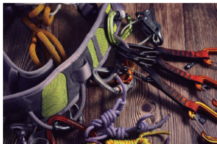
PROTECCIÓN CONTRA CAIDAS