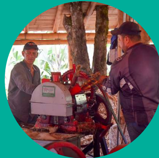
Hacienda Charrascal – trapiche panelero