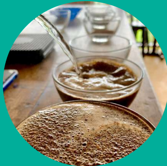
Tío Conejo – Experiencia de café especiales