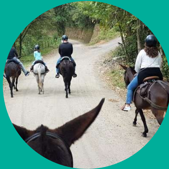
La Juana – Turismo ecuestre