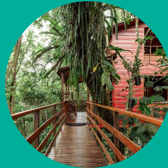
Tominejo – Casas en los arboles